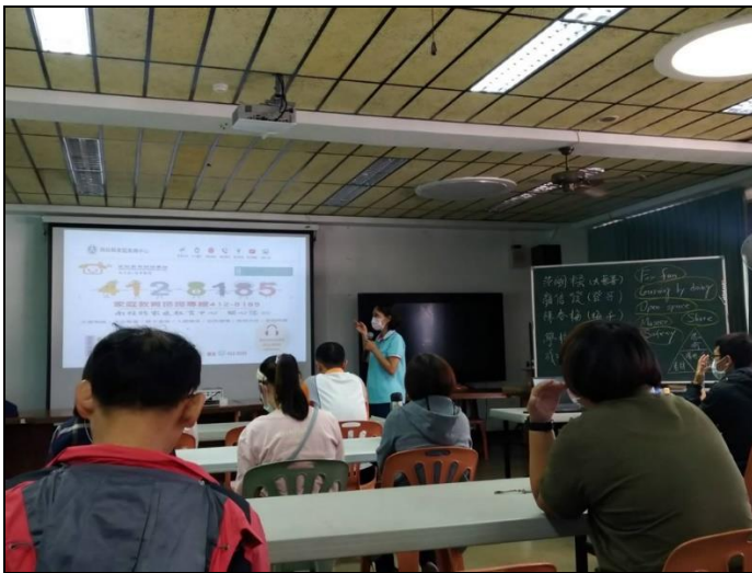
說明家庭、學校與社區間的關係