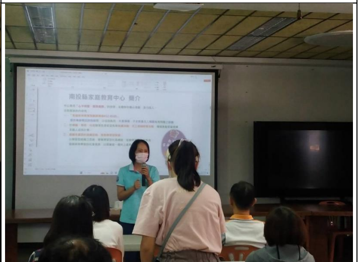
增進溝通協調意識，消除溝通障礙