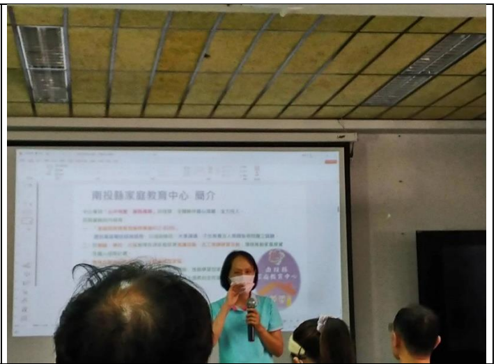
南投縣家庭教育中心簡介