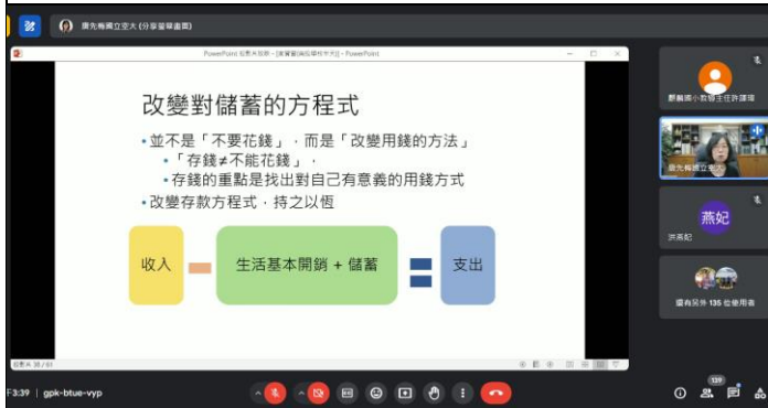
正確的家庭理財觀念